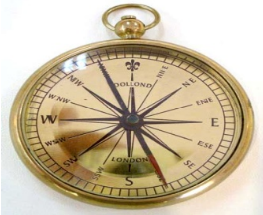
ภาพเข็มทิศ