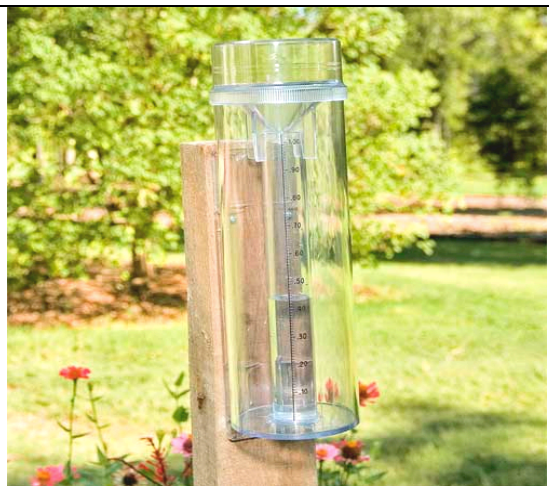
ภาพเครื่องวัดน้ำฝน