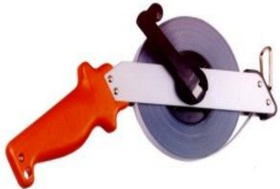
ภาพเทปวัดระยะ